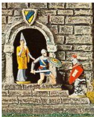
Abb. 6: Prinz Eisenherz verteidigt ein Burgfräulein (aus einem Hauser Elastolin-Katalog)