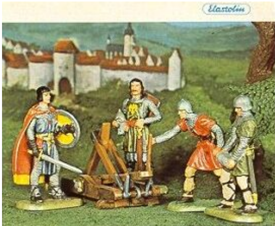
Abb. 5: Prinz Eisenherz und Gawain aus einem Hauser Elastolin-Katalog