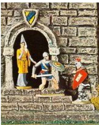
Abb. 6: Prinz Eisenherz verteidigt ein Burgfräulein (aus einem Hauser Elastolin-Katalog)