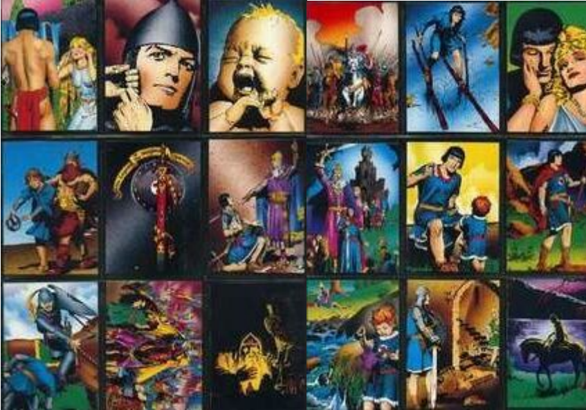
Abb.2: Sammelkarten (Auszug)