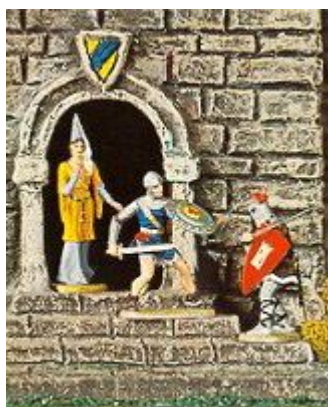
Abb. 6: Prinz Eisenherz verteidigt ein Burgfräulein (aus einem Hauser Elastolin-Katalog)