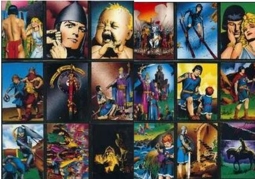
Abb.2: Sammelkarten (Auszug)