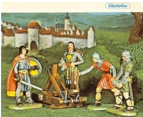
Abb. 5: Prinz Eisenherz und Gawain aus einem Hauser Elastolin-Katalog