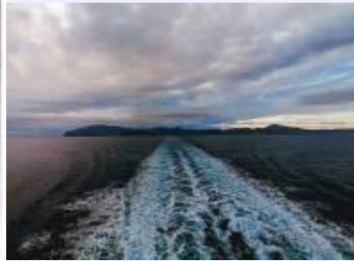
Bild 2: Die Insel Amorgos wie man sie von der Fähre aus sieht, Blickrichtung aus Nordwest nach Südost.