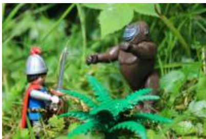
Abb. 5: Begegnung in Afrika (Seite 259f, Detail)