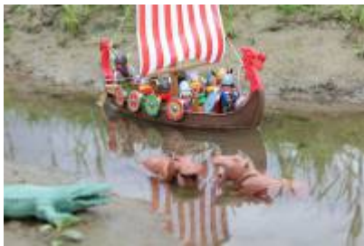
Abb. 4: In Afrika (Detail)