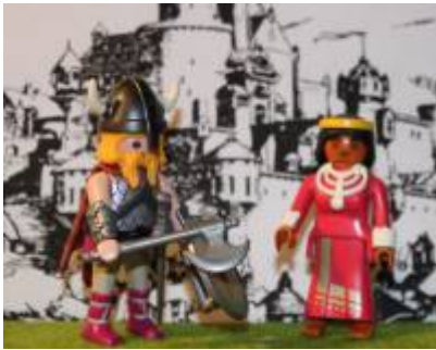
Abb. 9: Boltar und Tillicum