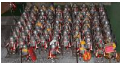
Abb. 16: Römische Centuria (Hundertschaft)