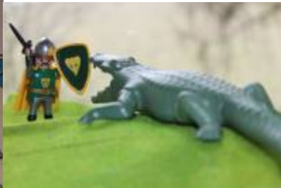
Abb. 13: Negarth kämpft gegen das Meereskrokodil (Seite 18)