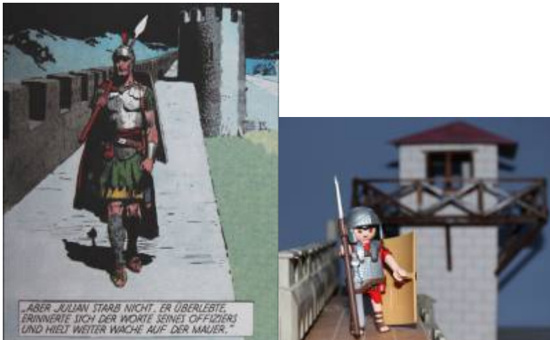
Abb. 15: Am Hadrianswall