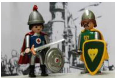
Abb. 6: Eisenherz und Gawain