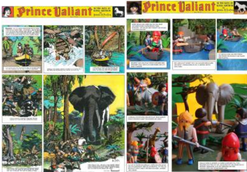
Abb. 3: In Afrika - Seite 25 im Original und in Playmobil