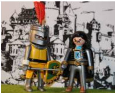
Abb. 10: Arn von Ord und Tristan