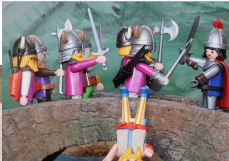
Abb. 2: Kampf an der Dundornschlucht (Seite 72) im Original und in Playmobil