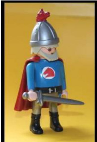
Abb. 12: Prinz Eisenherz mit 80