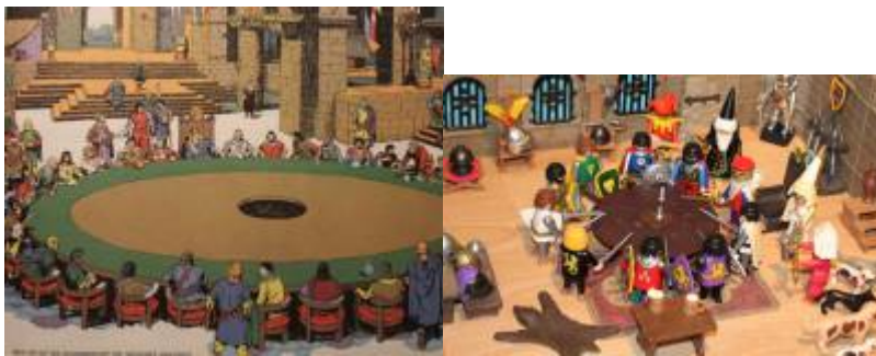
Abb. 1: Die Tafelrunde

Ein Klick auf ein Bild öffnet eine größere Darstellung!