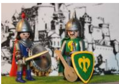
Abb. 7: Eisenherz und Gawain, Variante 2