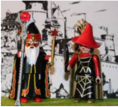
Abb. 8: Merlin und Morgana